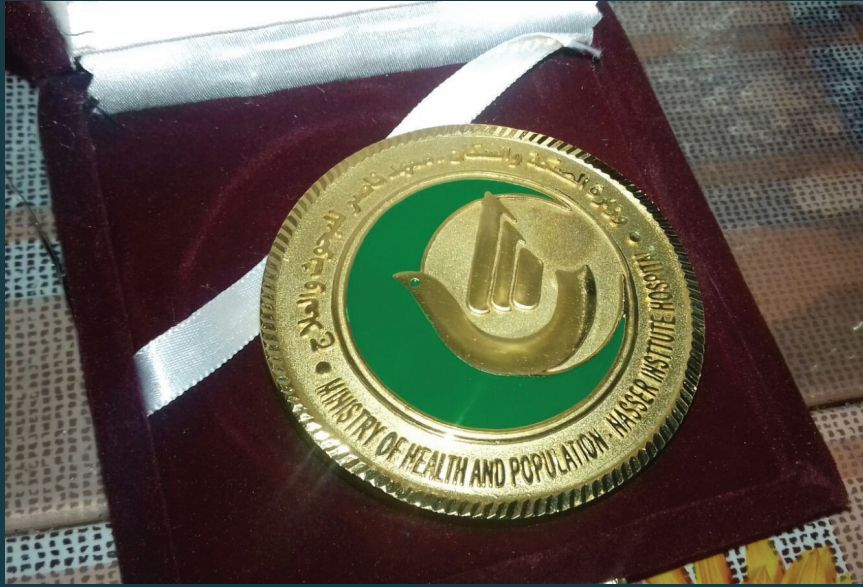
الميدالية الذهبية من معهد ناصر للبحوث العلمية