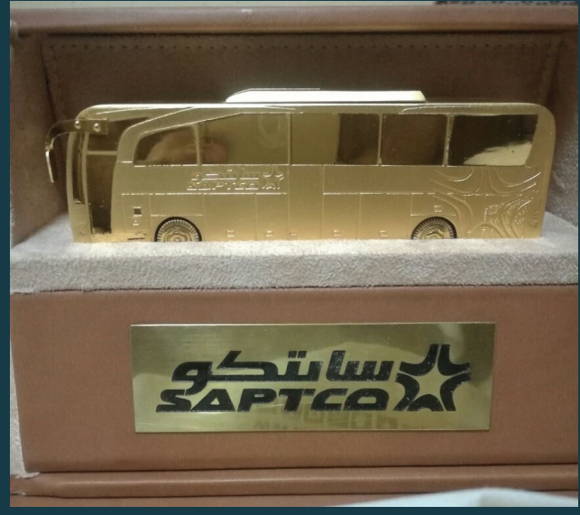
الباص الذهبي من شركة سابتكو للنقل الجماعي