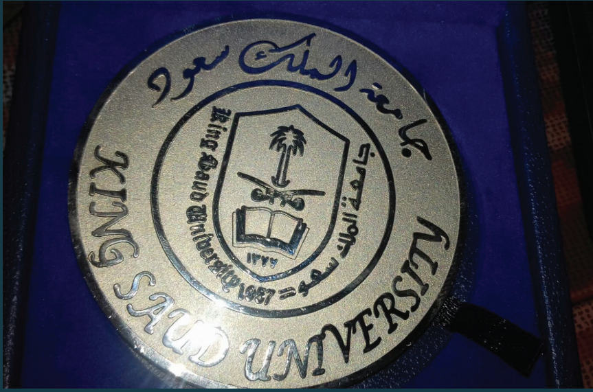
الميدالية الفضية جامعة الملك سعود