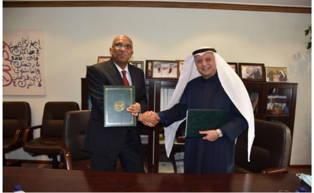
توقيع مذكرة التفاهم بين المعهد العربي للتخطيط وحكومة جمهورية السودان