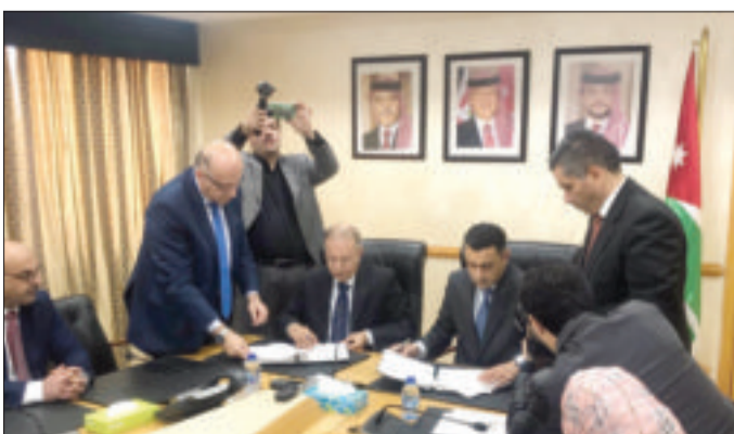
جانب من توقيع مذكرة التفاهم بين العربي للتخطيط، والنواب الأردني

وبين أهمية المذكرة برفد العديد من الجوانب المرتبطة بالواجبات المنوطة بكوادر الأمانة العامة للمجلس لإسما الداعمة لدور النواب التشريعي والرقابي.