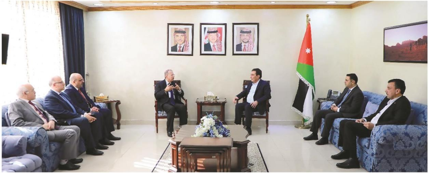
رئيس مجلس النواب الأردني خلال لقائه مدير عام المعهد العربي للتخطيط

وقع المعهد العربي للتخطيط مع مجلس النواب الأردني مذكرة تفاهم يقوم بموجبها المعهد بتقديم مجموعة من البرامج التدريبية المتخصصة والخدمات الاستشارية والبحثية والدعم الفني والمؤسسي.