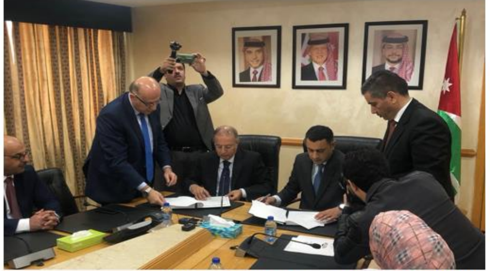
مدير (العربي للتخطيط) وامين عام (النواب الاردني) خلال المراسم