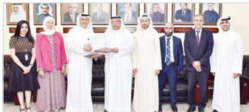
الخياط والبناي بعد توقيع مذكرة التفاهم

من جانبه، أكد البناي أن المركز يسعى من خلال برامج عمله إلى النهوض بكافة مؤسسات المجتمع، ونشر ثقافة الابتكار، عبر رعاية الموهوبين وتشجيع المبدعين. وشدد في هذا الصدد على ضرورة خلق فرص إبداعية حقيقية على أرض الواقع، منوهاً إلى أن المركز على أتم الاستعداد لدعم جهود التعاون والاستثمار في العنصر البشري في مختلف مجالات العلوم والتكنولوجيا.