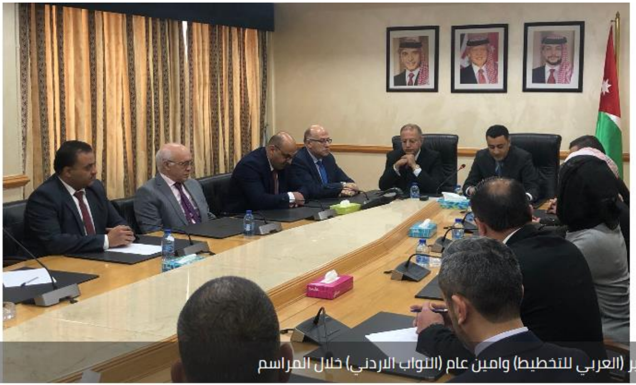
مدير (العربي للتخطيط) وامين عام (التواب الاردني) خلال المراسم