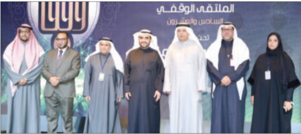
الجلامة والسجاري في لحظة تذكارية مع المشاركين