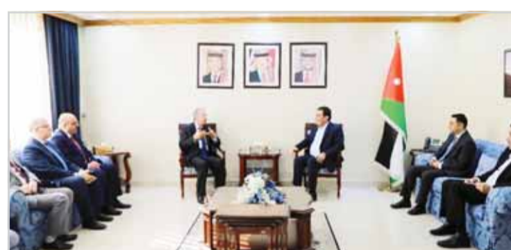
رئيس مجلس النواب الأردني خلال لقائه مدير عام المعهد العربي للتخطيط

ولفت إلى أن الكويت "سباقة" في مجال تقديم الدعم التنموي والإنساني في مختلف دول العالم لا سيما الدول النامية مبيناً "فاعلية" الدور الذي تقوم بها المؤسسات التنموية الكويتية الرسمية والأهلية "تحت راية قائد العمل الإنساني سمو أمير البلاد الشيخ صباح الأحمد الجابر الصباح". وقال من جانبه أكد أمين عام مجلس النواب الأردني عبد الرحيم الواكد لـ (كونا) أهمية المذكرة بتعزيز التعاون مع المعهد في مجال تقديم الدعم الفني والتدريب خاصة في البرامج التي ينفذها وذلك عبر ايجاد موظفي الأمانة إلى مقره في الكويت.