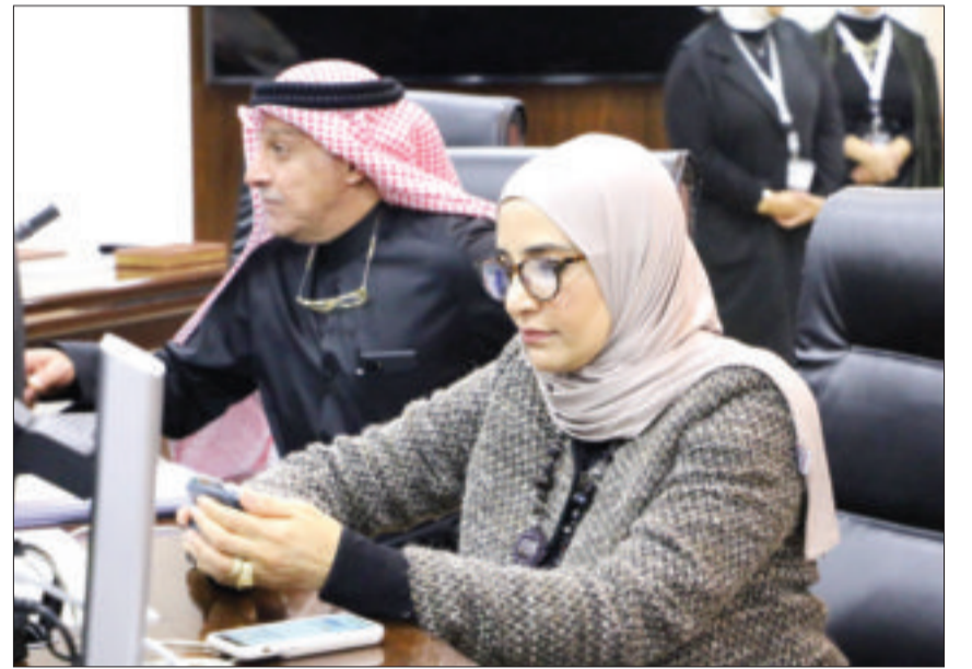
العقيل تتابع عملية إجراء التوقيع